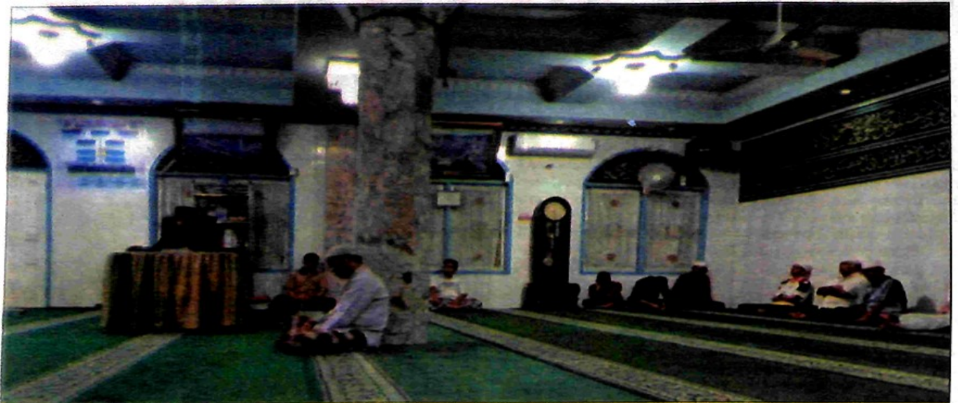
KULTUM: Seorang anak Panti Asuhan Aisyiyah sedang memberikan kullum di Masjid Nurul Silaiang Atas beberapa waktu yang lalu.

Mengunjungi Panti Asuhan Aisyiyah Padangpanjang