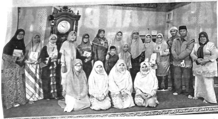
PERSAUDARAAN Muslimah (Salimah) Kota Padangpanjang foto bersama anak yatim dan stakeholder di Masjid Nurul Furqan, Kelurahan Tanah Pak Lambik, Minggu (17/4).

PADANGPANJANG, KP - Memperingati Nuzul Qur'an 1443 H, Organisasi Persaudaraan Muslimah (Salimah) Kota Padangpanjang menggelar berbagai kegiatan di Masjid Nurul Furqan, Kelurahan Tanah Pak Lambik, Minggu (17/4). Selain pengajian juga dilakukan pemberian santunan kepada anak yatim.