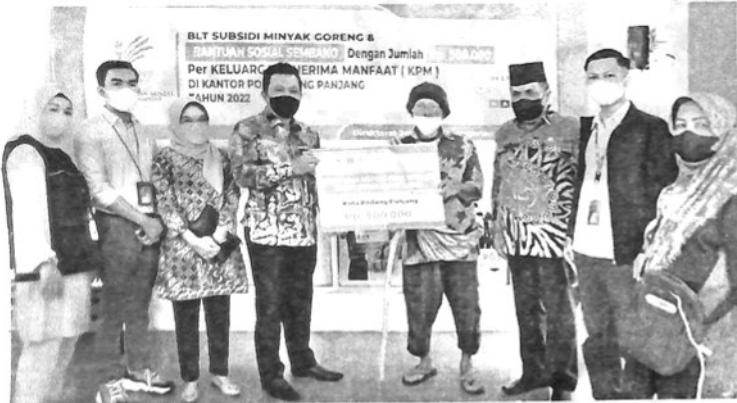
WAKIL Walikota Padangpanjang Asrul menyalurkan Bantuan Program Sembako (BPS) Tahap II dan Penebalan Sembako (BLT Minyak Goreng) secara simbolis di empat titik penyaluran, Kamis (14/4).

PADANGPANJANG, KP - Wakil Walikota Padangpanjang, Asrul menyalurkan Bantuan Program Sembako (BPS) Tahap II dan Penebalan Sembako (BLT Minyak Goreng) kepada 1.871 KPM