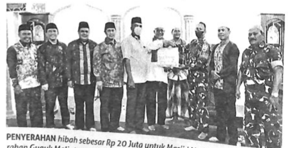
PENYERAHAN hibah sebesar Rp 20 Juta untuk Masjid Mujahiddin Secata B Kelurahan Guguk Malintang, Kecamatan Padangpanjang Timur (PPT), Kamis (14/4).

Acara tersebut juga diikuti TSR VI lain, di antaranya Kepala Badan Mete-